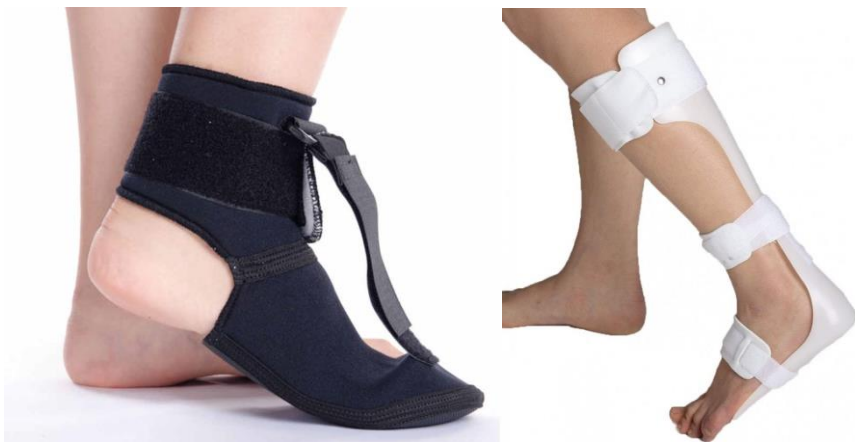
Figuur 3: Voorbeelden van een antidropvoetspalk.

We adviseren u om geen gebruik te maken een antidropvoetspalk in de eerste zes weken na ontstaan van de dropvoet (klapvoet).