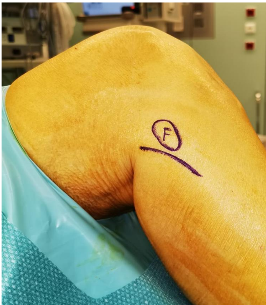
Figuur 4: Foto van de voorbereiding van de chirurgie. U ziet de buitenzijde van de knie. De huid van het onderbeen heeft een gelige kleur door ontsmetting met een joodhoudende ontsmettingsstof. Het kopje van het kuitbeen bevindt zich ongeveer onder de omcirkelde hoofdletter F. De snede of incisie verloopt lichtjes gebogen, net onder de kop van het kuitbeen.

De chirurg zal een kleine snede maken aan de buitenzijde van de knie, net onder het kopje van uw kuitbeen. Onderstaande foto geeft u een idee over de afmetingen van deze snede.