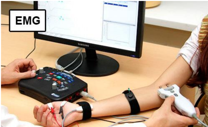
Figuur 2: Een elektromyografie. In dit onderzoek wordt de elektrische activiteit van de spier gemeten na stimulatie van de spier activerende zenuw.